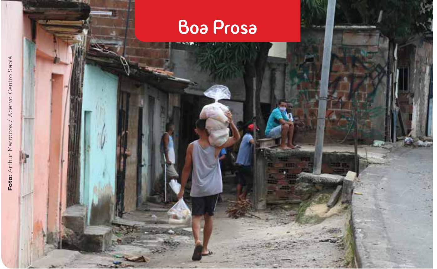
Entrega de cestas agroecológicas na comunidade do Bode, Boa Viagem, Recife (PE).