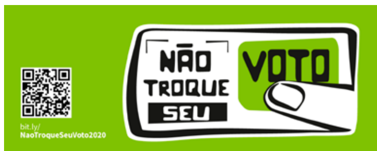
Campanha Não Troque Seu Voto da Articulação Semiárido Brasileiro (ASA).

Todo o material da campanha esta disponível no link: https://cutt.ly/ah6IPeA